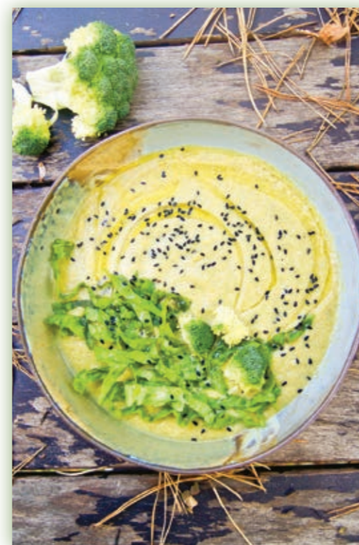
fol. Iwona Zasuwa