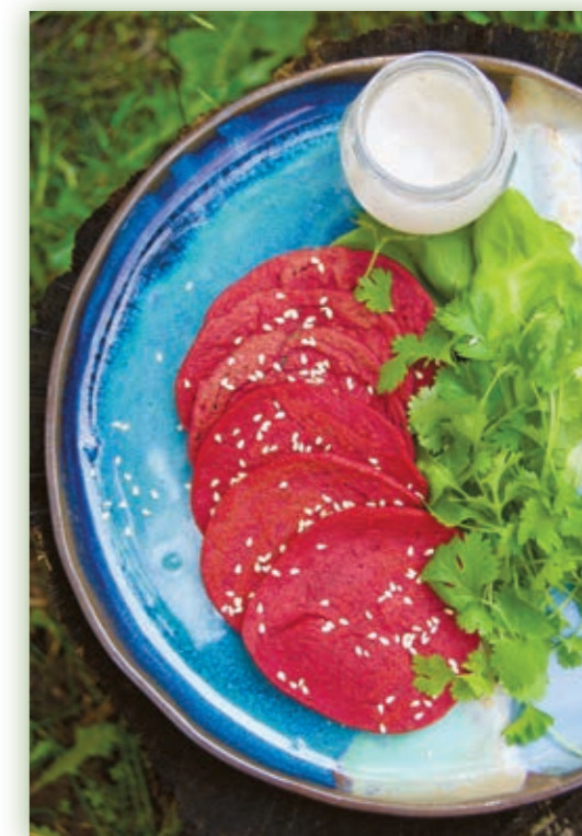
fol. Iwona Zasuwa

Przepisy pochodzą z książki „Smakoterapia na wynos” Iwony Zasuwy, wyd. Edipresse Książki